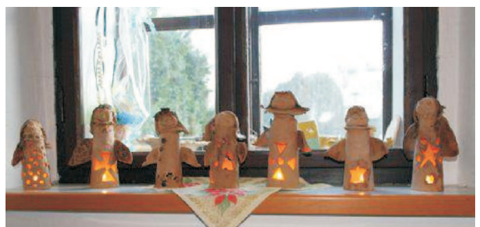
Vernisáž keramického kroužku