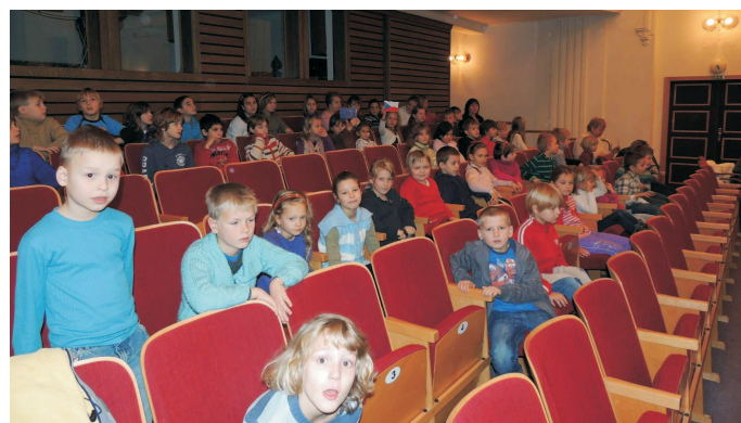
Putování za Ježíškem