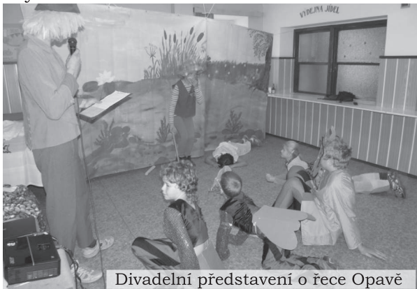
Divadelní představení o řece Opavě