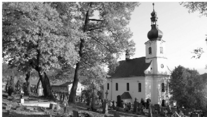
Stromy na hřbitově byly ošetřeny