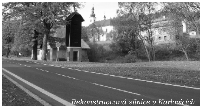
Rekonstruovaná silnice v Karlovicích