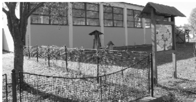
Prostor před tělocvičnou byl osázen stromy a keří