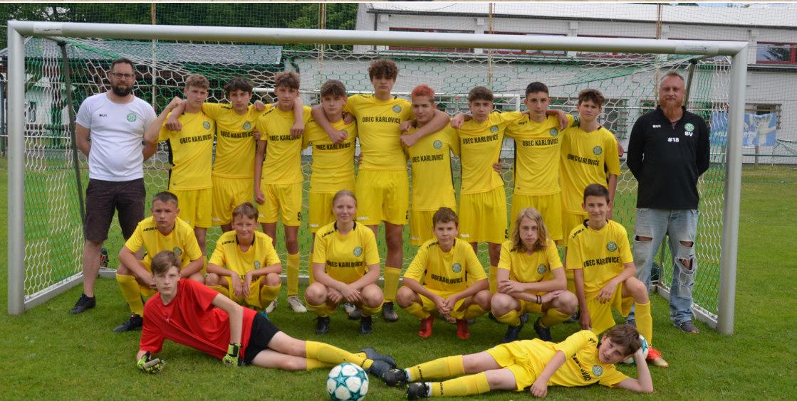
Úspěšná sezóna fotbalistů