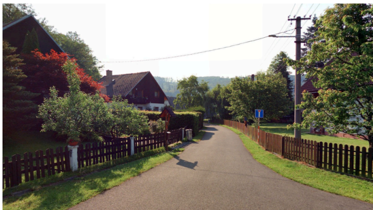
Obr. 1: Typická ulice v Karlovicích

Tradiční zástavba v obci má charakter nazývaný "jednotný jesenický dům", případě "dům východosudetského typu". Tento typ se v obci vyskytuje od období po Třicetileté válce, předchozí způsob zástavby je dnes reprezentován jediným dochovaným objektem z té doby, karlovickou Kosárnou. Od devatenáctého století se v obci vyskytuje romantizující zástavba malých vil a lázeňských staveb. Zástavba od druhé poloviny dvacátého století do současnosti je velmi různorodá, bez jednotného společného charakteru.