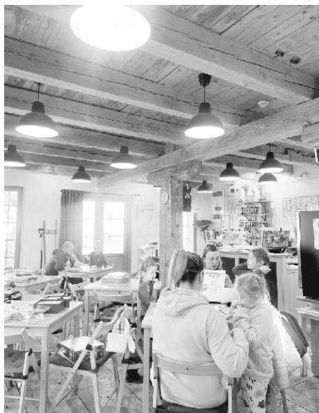
z akcí VÍCE Ve mlýně Karlovice